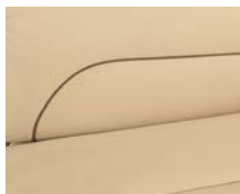
+ Echtleder-WW Skylight ○