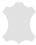
+ Echtleder Individual ○