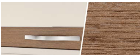
+ Holzdekor Virginia Eiche