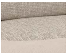
+ Wohnwelt Goa ○