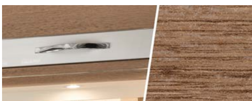
+ Alternative Dachschrank-Klappen ○