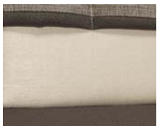
+ Wohnwelt Amaro