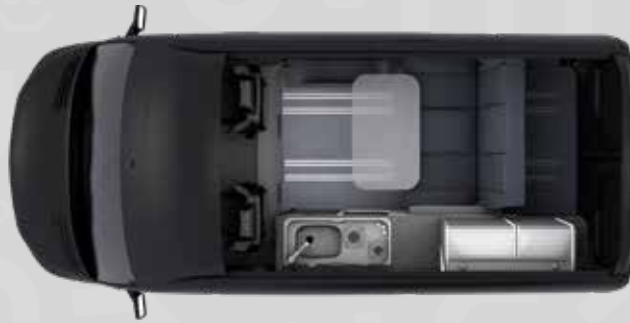
YUCON 51 SB