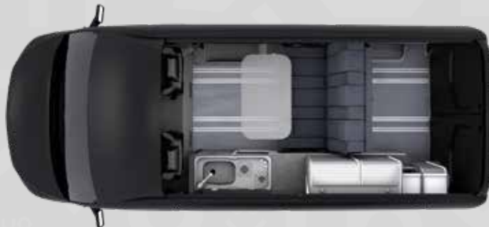
YUCON 55 SB

Alle Infos zur Serienausstattung findest du ab Seite 29.