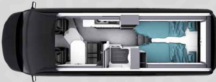
YUCON 63 G