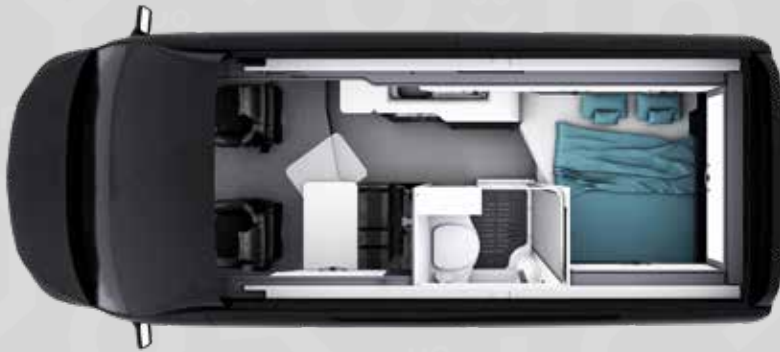
YUCON 54 B

Alle Infos zur Serienausstattung findest du ab Seite 19.