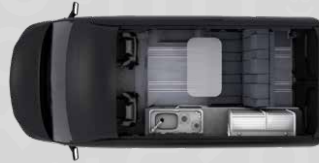
YUCON 51 FB