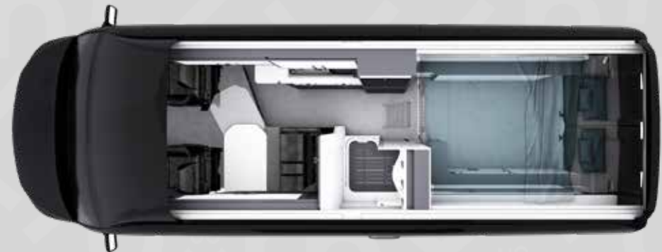
YUCON 63 H