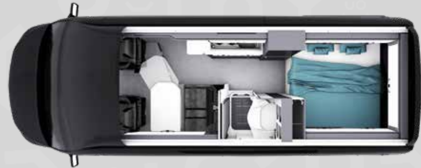
YUCON 60 B