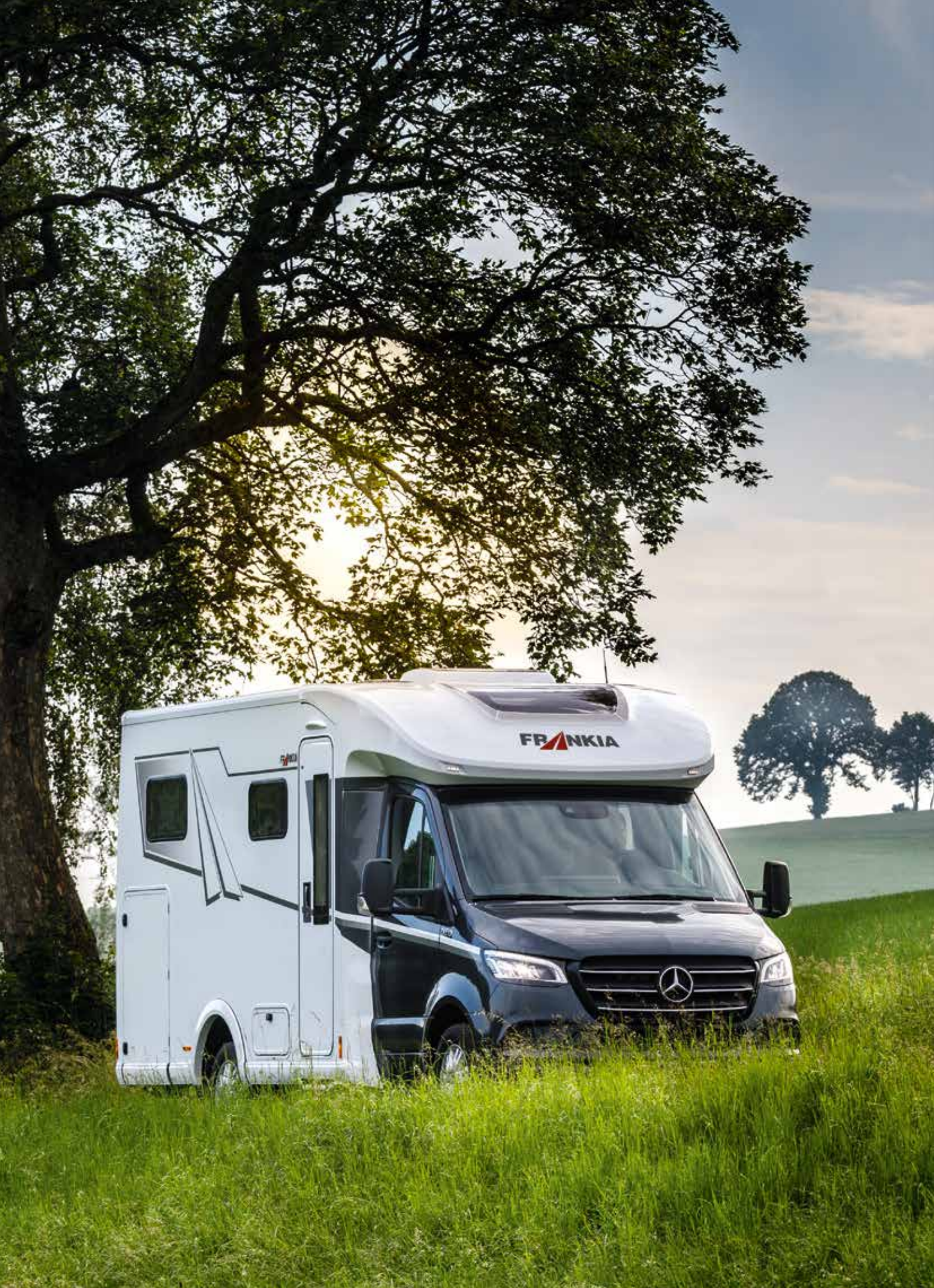
2 FRANKIA MT 7 GDK NEO (Abbildung beispielhaft)