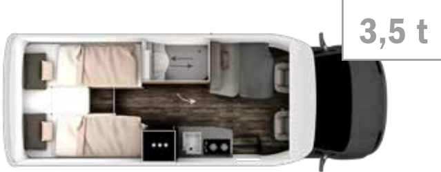
MT 7 GDK 7,0 m 3,5 t/4,5 t 2/3 2/4