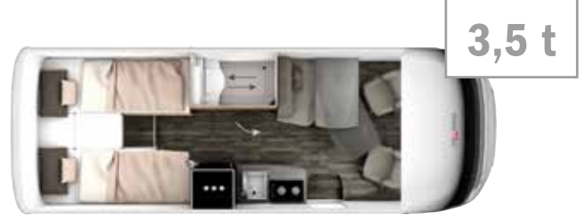
MI 7 GDK 7,0 m 3,5 t/4,5 t 2/4 2/4