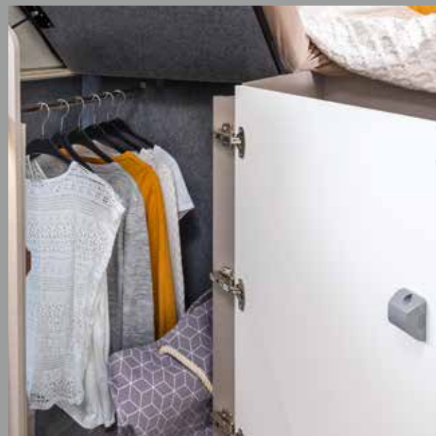
Clever: der Kleiderschrank unter dem Bett