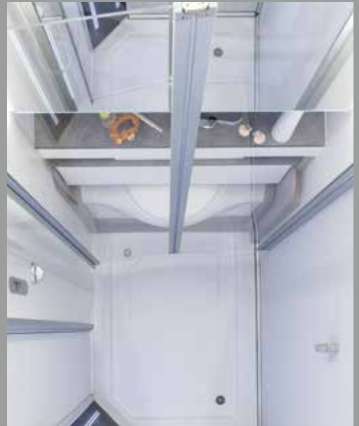
Wellnessdusche mit extragroßer Wanne