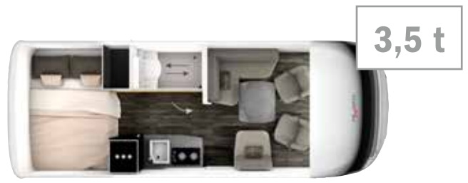
MI 7 BD 6,8 m 3,5 t/4,5 t 2/4 2/4