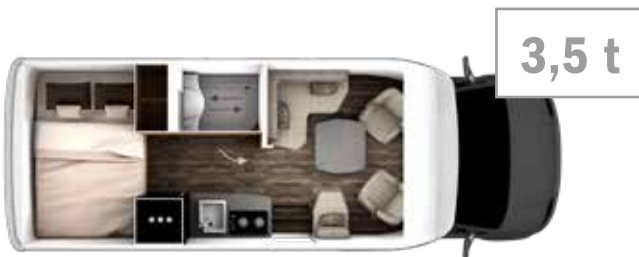
MT 7 BD 6,8 m 3,5 t/4,5 t 2/3 2/4