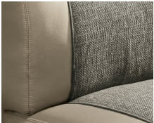
+ Wohnwelt Camino