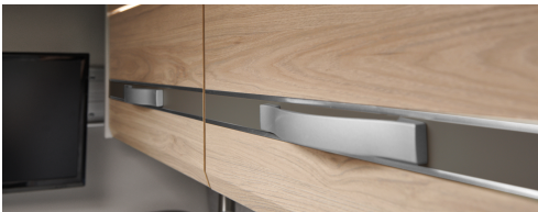
+ Möbeldekor Noce Nagano