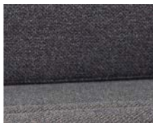
+ Wohnwelt Melia ○