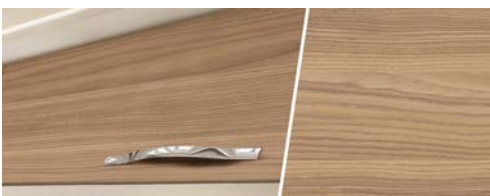
+ Holzdekor Ashton