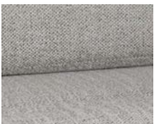
+ Wohnwelt Samir