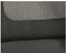
+ Wohnwelt Ravello