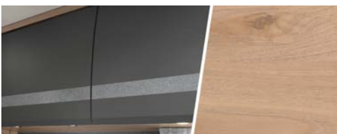
+ Holzdekor Noce Nagano