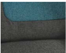
+ Wohnwelt Salerno inkl. Fahrer- und Beifahrer-Sitzbezug ○