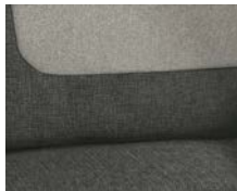
+ Wohnwelt Calypso inkl. Fahrer- und Beifahrer-Sitzbezug ○