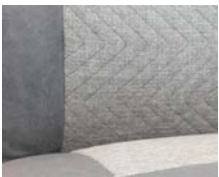
+ Wohnwelt Hygge