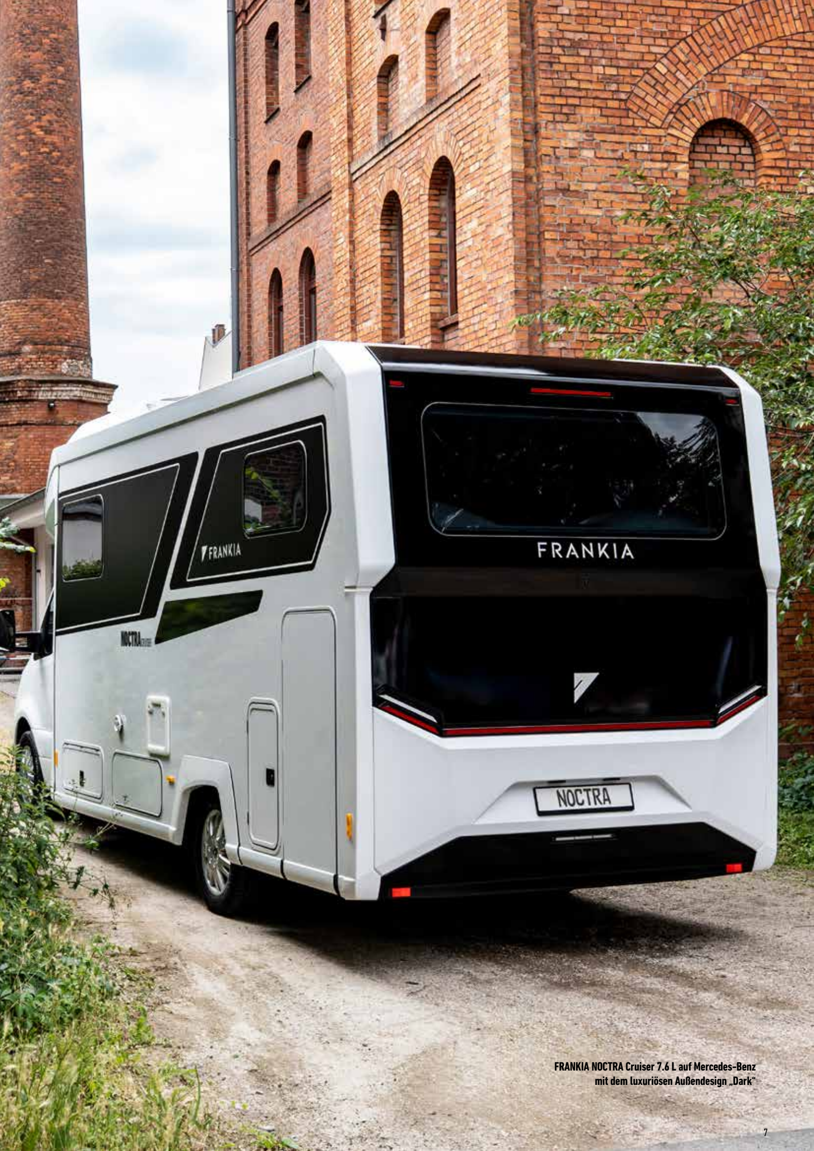
FRANKIA NOCTRA Cruiser 7.6 L auf Mercedes-Benz mit dem luxuriösen Außendesign „Dark“