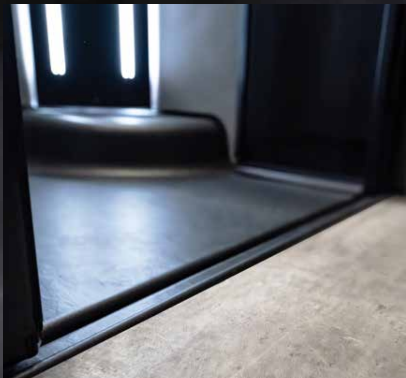
Gehört in jedes luxuriöse Design-Badezimmer: die bodengleiche Dusche