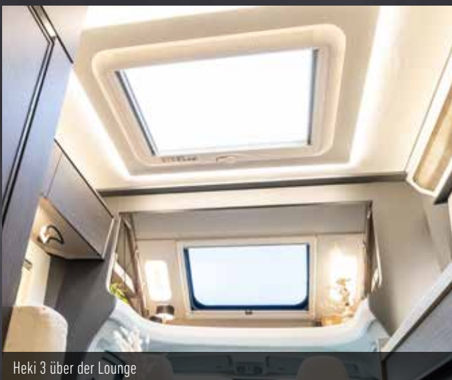
Heki 3 über der Lounge