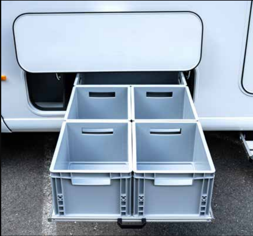
Highlight: großes, durchgängiges Stauraumfach – optional mit Touch-Öffnung und Auszugssystem