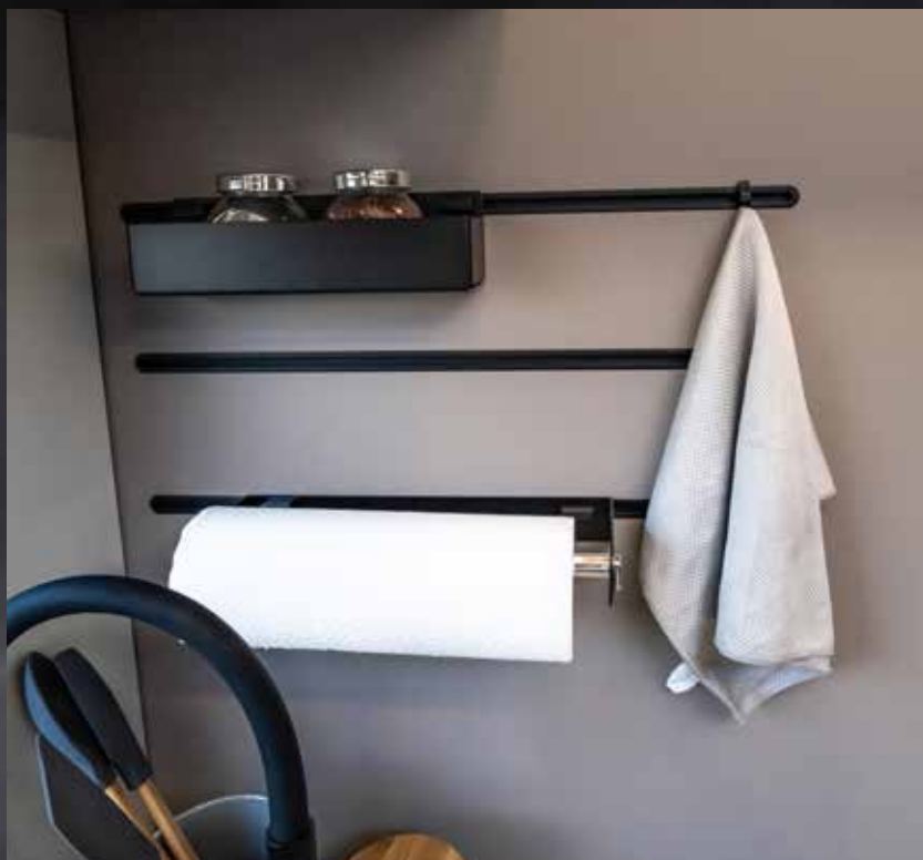
Modulares Regalsystem – mit flexiblen Ablagemöglichkeiten und Hängevorrichtungen