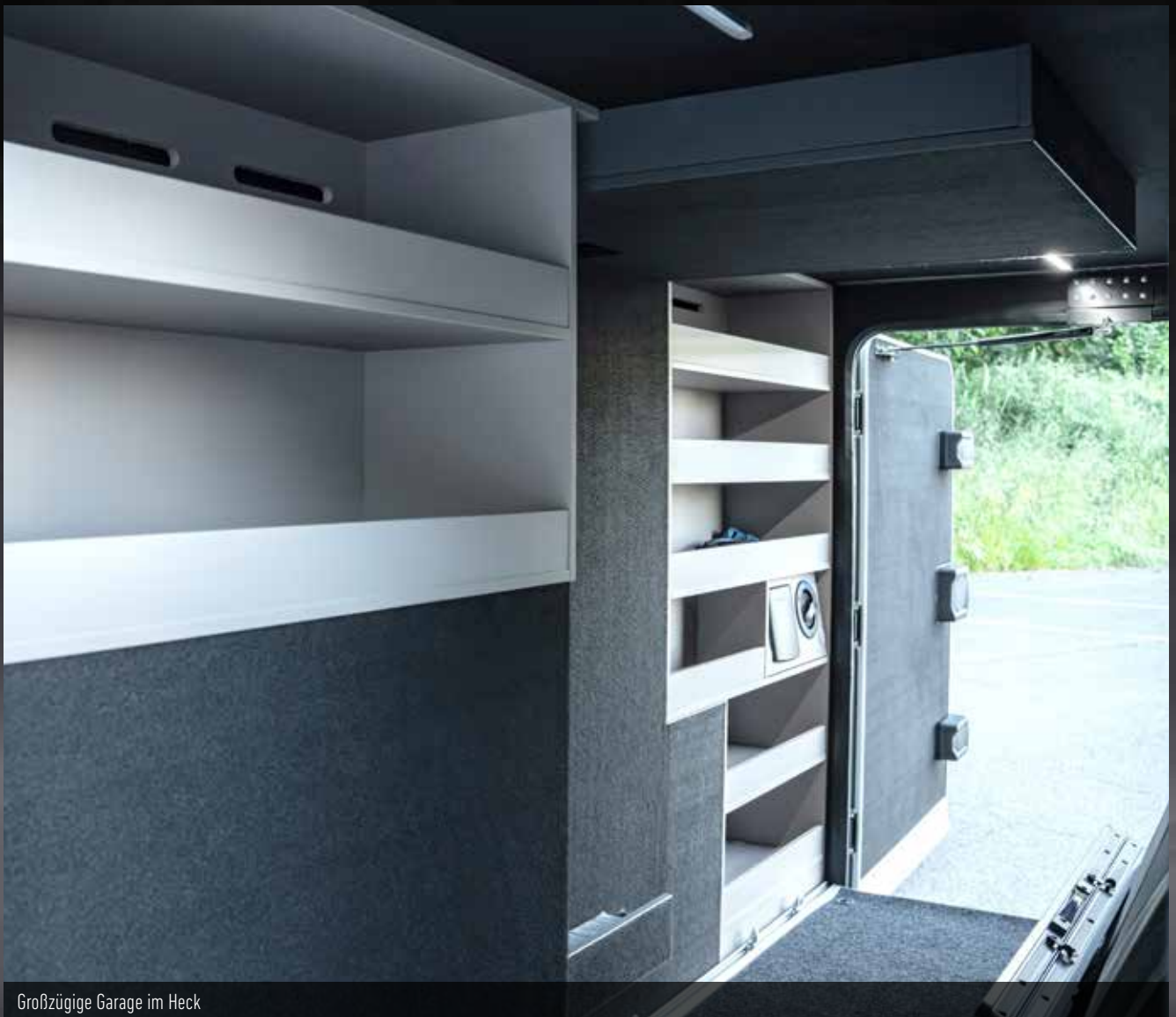
Großzügige Garage im Heck