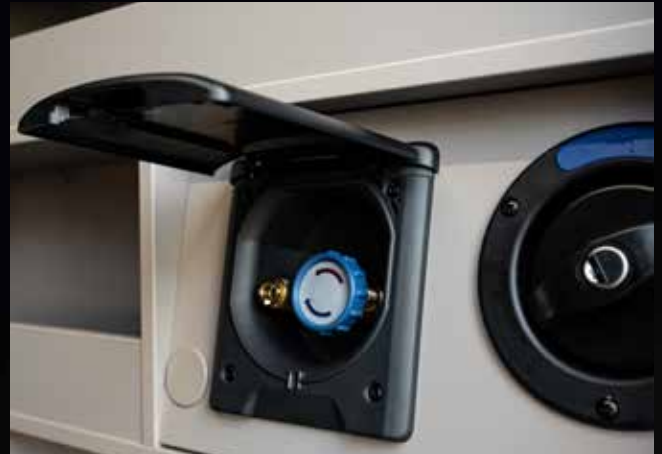
Notbefüllung und Anschluss Außendusche Heckgarage