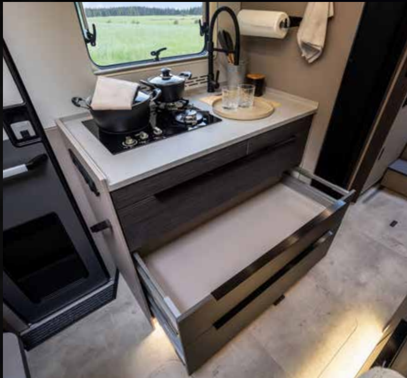
Der besonders tiefe Küchenblock im NOCTRA sichert maximalen Stauraum für Teller, Tassen und Co.