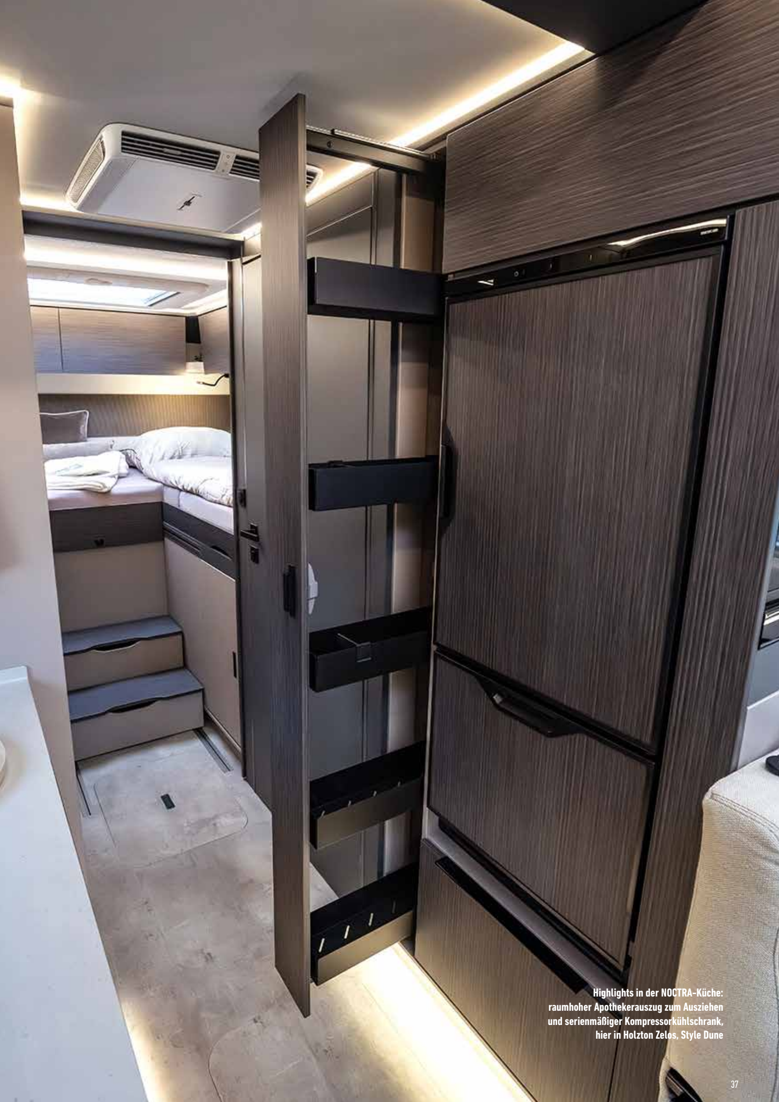
Highlights in der NOCTRA-Küche: raumhoher Apothekerauszug zum Ausziehen und serienmäßiger Kompressorkühlschrank, hier in Holzton Zelos, Style Dune