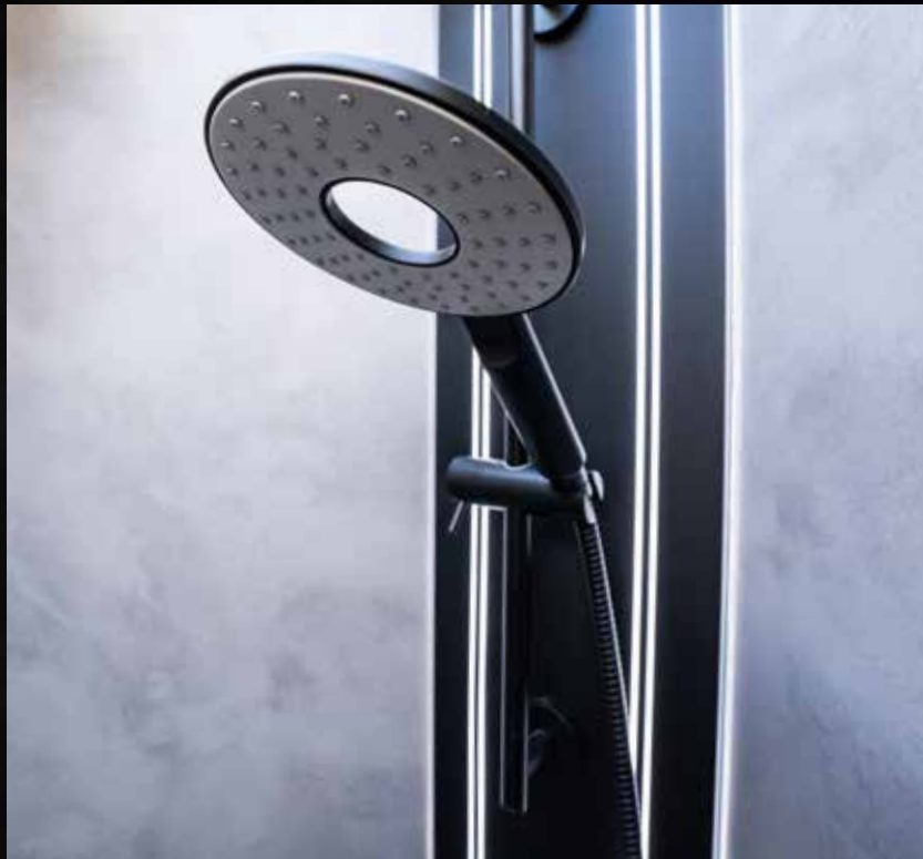
Entspannung pur in edler Umgebung: neuer Wellness-Duschkopf und neues Wand-Design