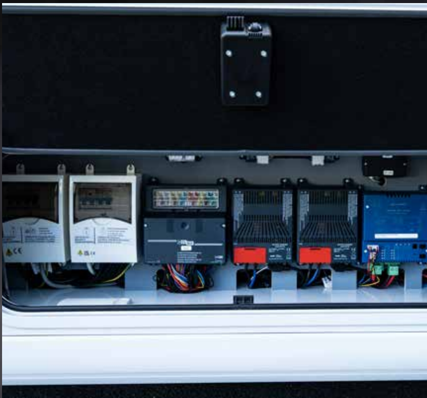
Ordnung 2.0: neues Doppelbodensystem mit separatem Elektronikfach