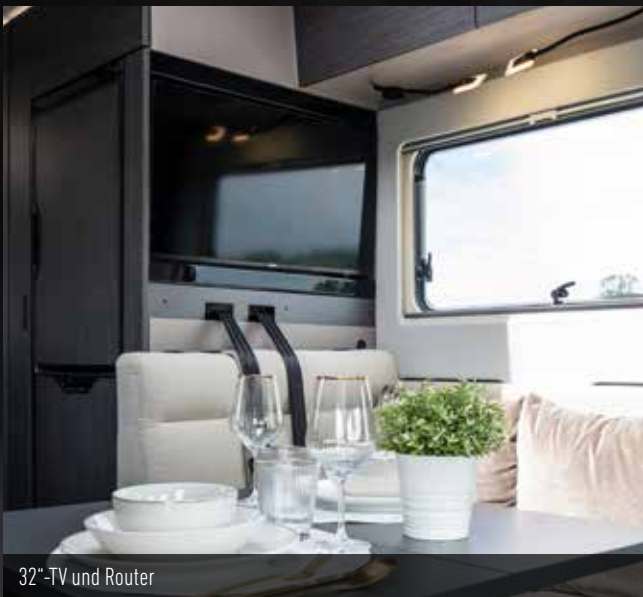
32"-TV und Router